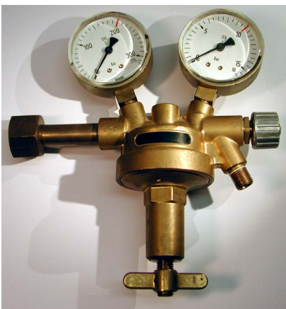
Abb. 1: Flaschendruckminderer

Aufbau und Funktion von des Reduzierventils: Gase in Druckgasflaschen stehen unter hohem Druck. Ohne den Einsatz eines Druckminderers (Reduzierventils) würde dieses beim Öffnen der Entnahmestelle mit sehr hohem und kaum kontrollierbaren Druck entweichen. Mit dem Druckminderer lässt sich der Entnahmedruck herunter regulieren.