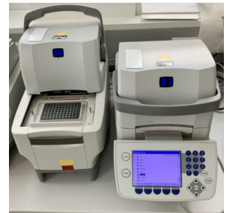
Abb. 1: Ein Thermocycler. Ein cooles Video zur PCR: